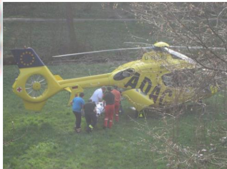
Abtransport: Nach nur 24 Minuten auf dem Weg in die Klinik

Schwer verletzt wurde am 03.04 ein Motorradfahrer bei seinem Ausflug. Infolge eines Fahrfehlers kam der Biker kurz vor dem Ortseingang Heiligkreuzsteinach zu Fall. Der Fahrer wurde unter der Leitplanke hindurch geschleudert und stürzte die ca. 8 m hohe Böschung hinunter. Da im Steinachtal kein adäquates Rettungsmittel zur Verfügung stand bat die Leitstelle Rhein-Neckar um Unterstützung bei Ihren Kollegen aus Heppenheim. Diese alarmierten dann umgehend den RTW aus Gornheim und die First Responder. Der Notarzt kam mit Christoph 5 zur Einsatzstelle. Die Einsatzkräfte versorgten den Patienten und sicherten die Einsatzstelle bis zum